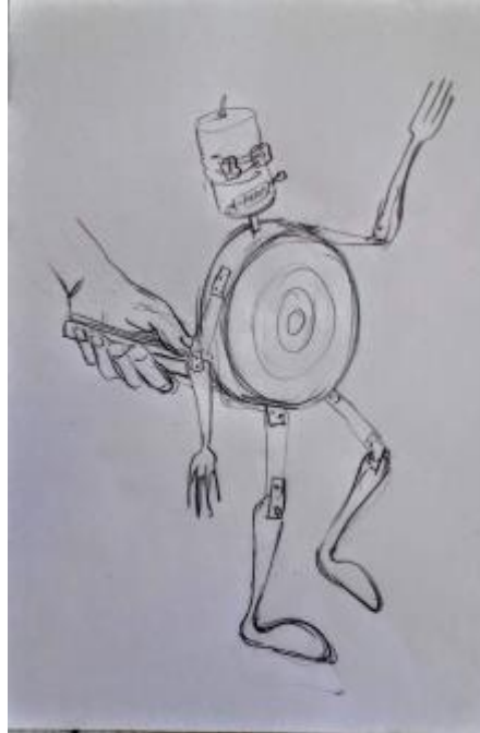
(Bocetos del muñeco)