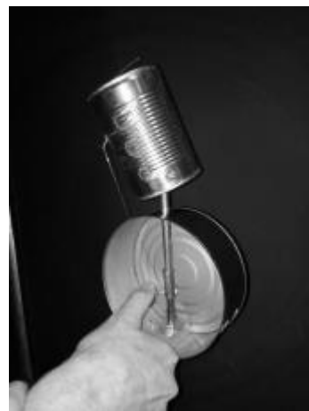
(Prueba del prototipo)