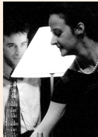
El amante, de Harold Pinter.