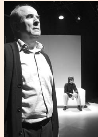
A Number, de Caryl Churchill.

España es un país que no cuida mucho el lenguaje. Hemos de potenciar el gusto por la musicalidad del habla desde las escuelas de Arte Dramático. El alumno viene con muy poca base y para nuestra profesión es fundamental este aspecto. Los esfuerzos que hay que hacer son muy grandes y diversos. Debemos potenciar el sentido del ritmo, la prosodia, la dicción... Existe poco refinamiento en la utilización del lenguaje y un actor necesita un conocimiento muy profundo de esta materia. Eso, sin duda, y entre otras cosas, elevaría significativamente nuestro nivel actoral.