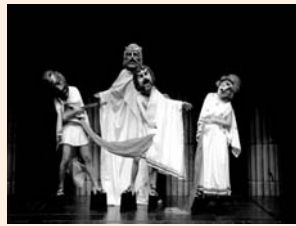
El gran secreto.

Nos encontramos en la cartelera madrileña con dos espectáculos que pueden ser comparables. El primero, El gran secreto , de Els comediant, se presentó en el Teatro Gran Vía. Una vacía excusa les sirve para comenzar su obra en la que dos acomodadores, dos técnicos y un espectador (dramaturgo) deciden confirmar la tesis de que el teatro define la forma en la que amamos. Nos muestran desde los griegos hasta nuestra época cómo el teatro habla del amor.