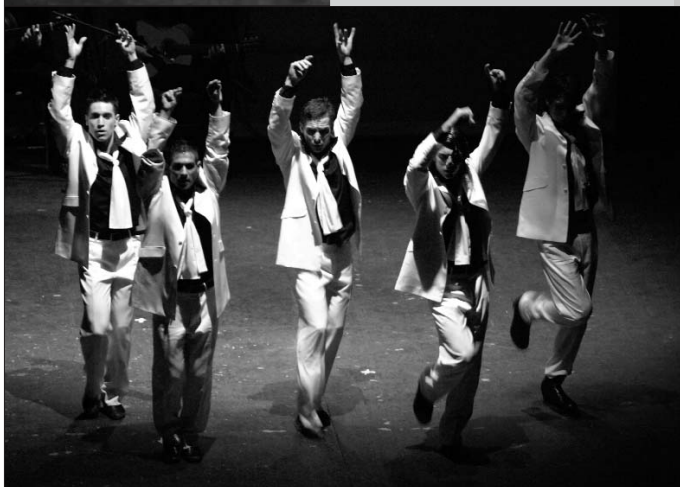
Muestra del Conservatorio Profesional de Danza.