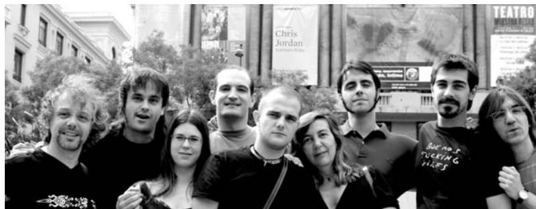
Equipo artístico de Enemigo de clase.