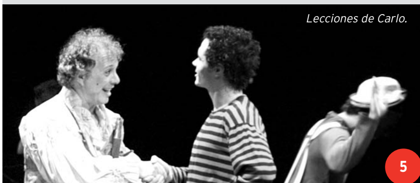
Lecciones de Carlo.