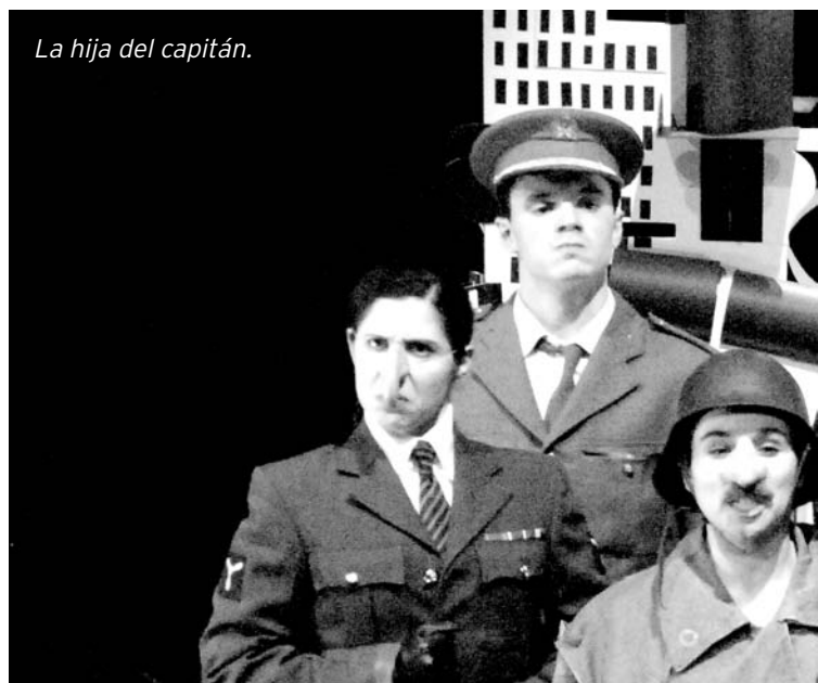
La hija del capitán.