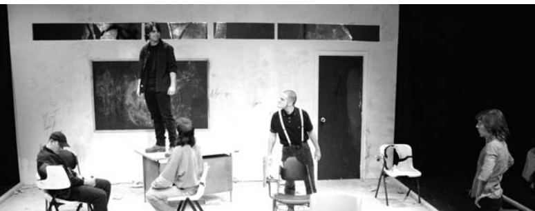
Enemigo de clase.

Hay que saber que en Italia también está considerado como un tipo de teatro casi de museo, hay muy pocas compañías. Italia no tiene en cuenta sus capacidades. La Commedia se trata de una manera de hacer teatro, donde hay un trabajo del actor. Ahora en toda Europa, nos piden a los italianos trabajar la Commedia fuera de nuestro país, justamente por esta necesidad de querer trabajar el arte de actor.