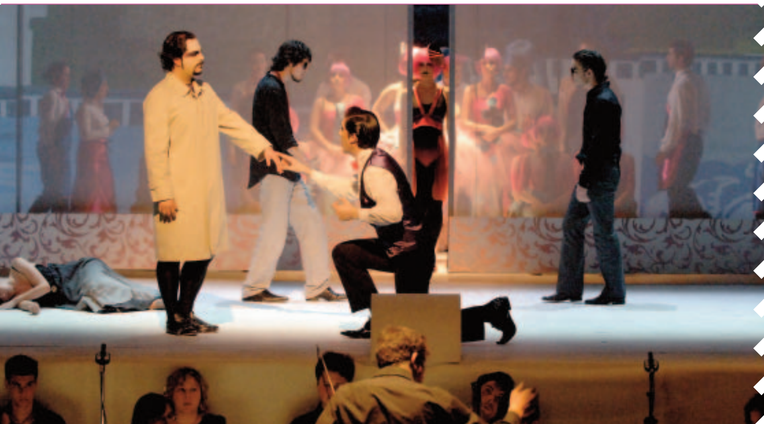
La reina de las hadas.

Los días 5 y 6 de junio, seis centros públicos de enseñanzas artísticas de la Comunidad de Madrid integraron a su alumnado para representar en la RESAD, como Taller de Fin de Carrera, la semiópera de Henry Purcell titulada La reina de las hadas , con dramaturgia de Álvaro Martínez de Lizarrondo y dirección de Pedro Martínez, ambos alumnos de cuarto curso de la especialidad Dramaturgia-Dirección. Más de cien alumnos pertenecientes a la RESAD, al Conservatorio Profesional de Música de Arturo Soria, el Centro de Tecnología del Espectáculo (INAEM), el Real Conservatorio Profesional de Danza "Mariemma", el Real Conservatorio Superior de Música, el Coro de Cámara "Duque de Calabria" y la Escuela Superior de Canto intervinieron en el espectáculo como actores, músicos, bailarines, escenógrafos, dramaturgos, sastres, maquinistas, figurinistas, técnicos, etc. El género operístico es el que mejor permite integrar en un espectáculo las áreas artísticas y gremios profesionales en un gran trabajo de equipo.