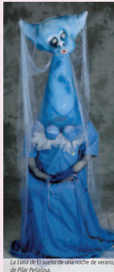
La Luna de El sueño de una noche de verano , de Pilar Peñalosa.