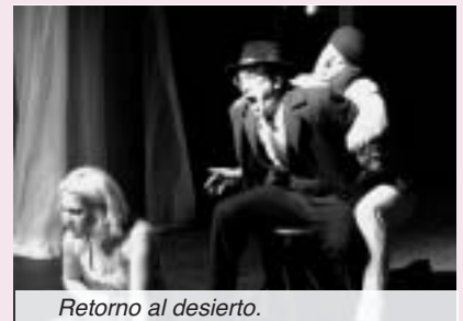
Retorno al desierto.

Los dos montajes se enmarcan dentro del intercambio de talleres y de estudiantes que desde hace años mantienen las Escuelas Superiores de Arte Dramático. Por su parte, los alumnos de la RESAD llevaron a Barcelona la obra de Caryl Churchill El bosque de los locos , con dirección de Mariano Gracia, y en Murcia presentaron La cruzada de los niños de la calle , con dramaturgia de Sanchis Sintiera y dirección de Andrés del Bosque.