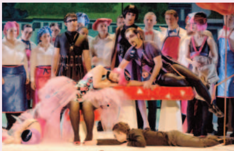
La reina de las hadas.